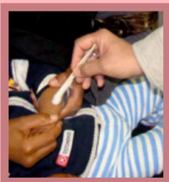
تهیه و تنظیم: فاطمه عابدی آستانه گرافیک: داود علیمحمدی

نکته: اگر زخم سالک از نوع مرطوب و در نقاط پوشیده بدن (مانند شکم یا ران) باشد با رعایت نکات بهداشتی، نیازی به درمان ندارد و پس از چندین ماه خود به خود بهبود می یابد؛ ولی چنانچه زخم عفونی شود یا وسعت یابد لازم است حتما درمان صورت پذیرد.